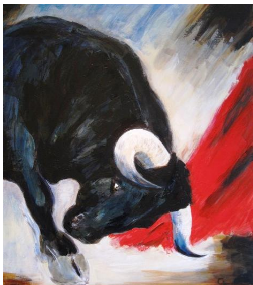
Schilderij Julien Geelen “Torero”

Werken met een stier vereist continue aandacht. Dat mocht ook mijn vader ervaren. Op een maandagmorgen in juli, terwijl mijn moeder machinaal de koeien molk en ik de tractor en grasmaaier klaarmaakte voor maaiwerk, ging vader de stierenstal proper maken. Dat betekent het natte stro met de stront opscheppen in de kruiwagen, proper borstelen en opnieuw instrooien met vers stro op de ligplaats. De stier werd tijdelijk aan de linkerzijde van de grote stal aangebonden om rechts veilig te kunnen werken. Dan werd de stier naar de rechterzijde omgebonden om het andere deel van de stal te verschonen. Maar dat ombinden beviel de stier niet echt.